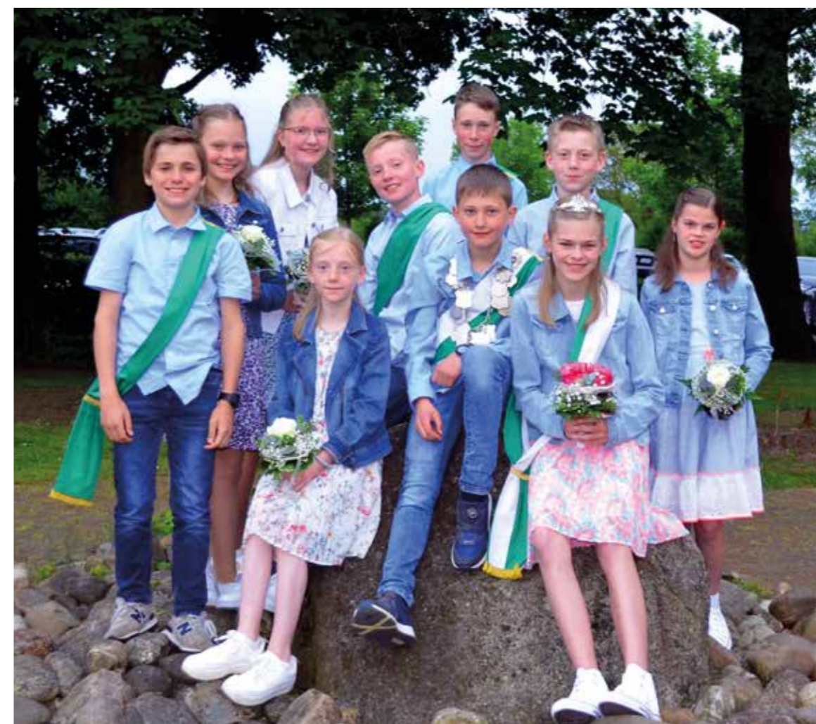
Kinderthron 2023 / 24

Mit einem plattdeutschen Wortgottesdienst unter der Mitgestaltung des gemischten Chores aus Bokern-Märschendorf fangen die offiziellen Schützenfesttage an.