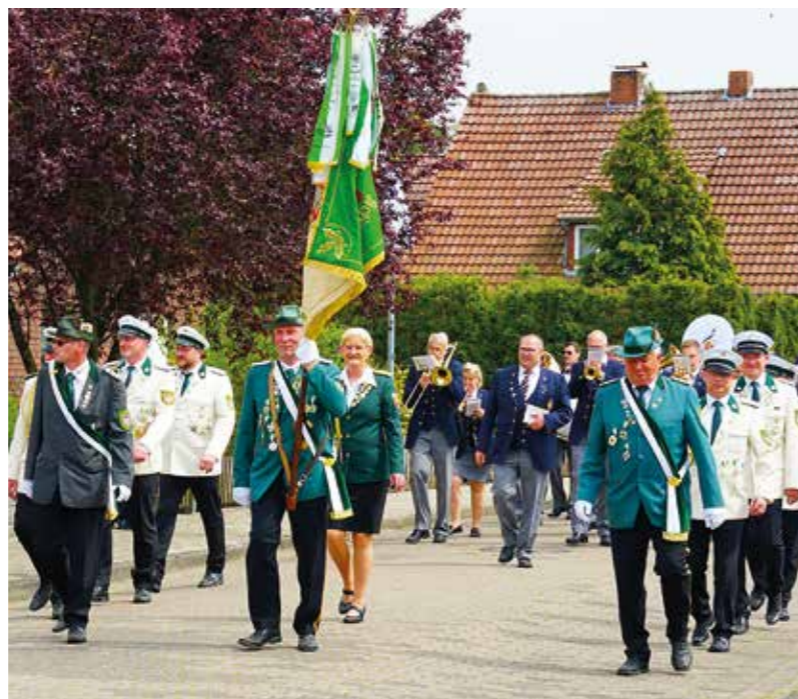
Festumzug des Schützenvereins Bokern-Märschendorf 2023